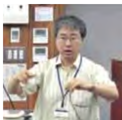
深瀬浩一・大阪大学教授