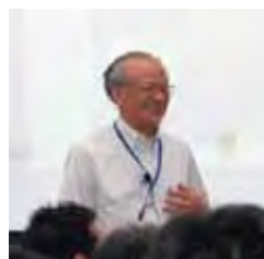
福山透・東京大学教授