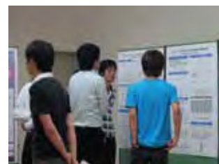
ポスターセッション