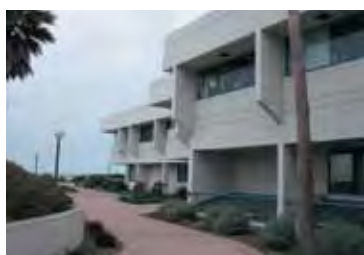
キャンパス内のMarine Science Institute