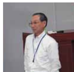
齊藤烈・京大名誉教授