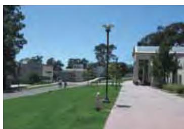
サンタバーバラ校のキャンパス風景